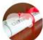
CERTIFICAÇÃO DE EMPRESAS E PRODUTOS