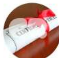
CERTIFICAÇÃO DE EMPRESAS E PRODUTOS