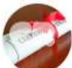
CERTIFICAÇÃO DE EMPRESAS E PRODUTOS