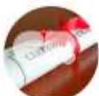
CERTIFICAÇÃO DE EMPRESAS E PRODUTOS