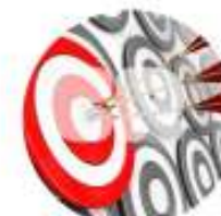
FERRAMENTAS PARA A PRODUTIVIDADE