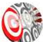
FERRAMENTAS PARA A PRODUTIVIDADE