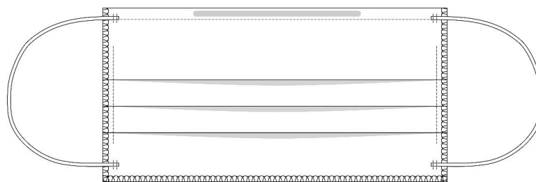
Vista do direito