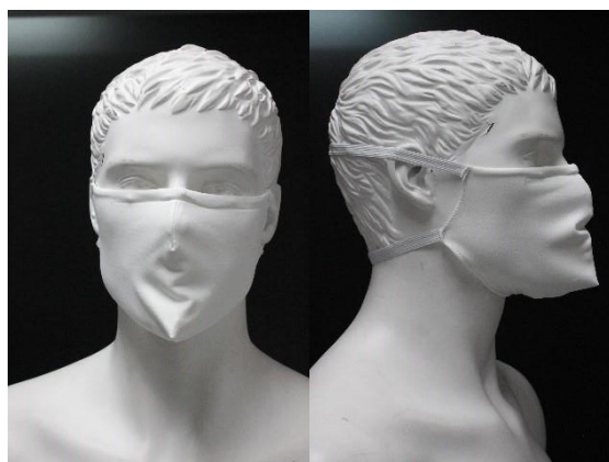
Vista de frente