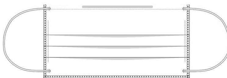
Vista do direito